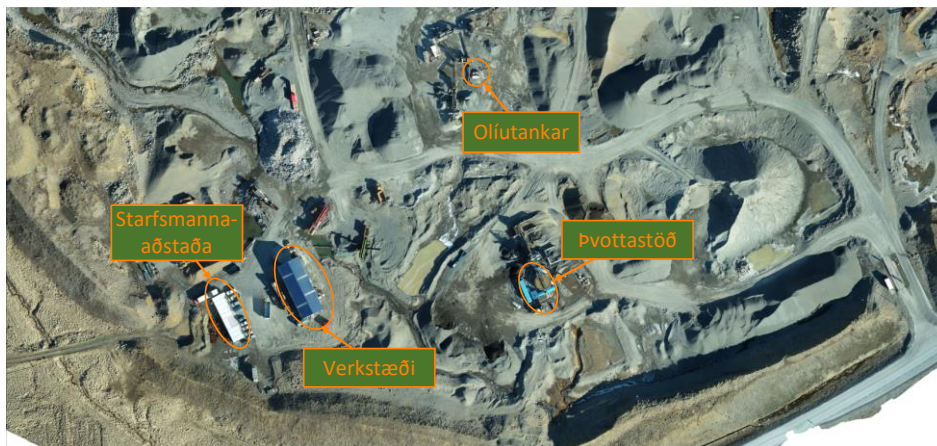
Mynd 4 Staðsetning starfsmannaaðstöðu, verkstæðis og olíutanka í Hólabrú.

Í Hólabrú eru tveir eldsneytistankar með litaða dísel olíu. Stærð þeirra er 6000 lítrar og 3000 lítrar. Staðsetning þeirra er sýnd á mynd 4.