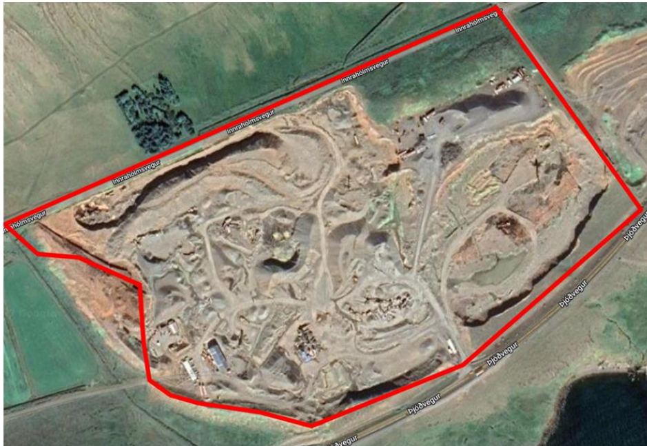
Mynd 1 Nýleg loftmynd af námunni í Hólabrú þar sem útlínur hennar eru sýndar.

Mynd 1 sýnir nýlega loftmynd af námunni og á hana eru teiknaðar útlínur svæðisins.