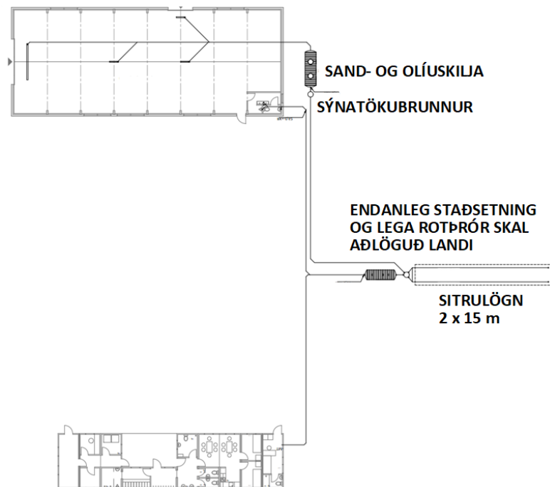
Mynd 3 Tengingar rotþróar og sand- og olíuskilju.

Verkfræðistofan Ferill hannaði útfærslu rotþróar og olíuskilju. Mynd 3 sýnir lagnir og tengingar frá starfsmannaaðstöðu og verkstæðisbyggingu að rotþró og sand- og olíuskilju.